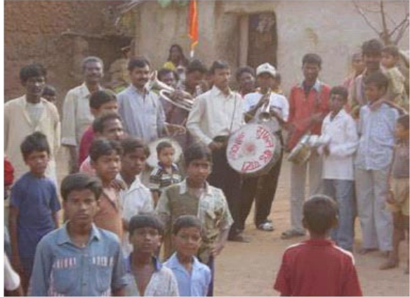
ପୁଲ୍‌ଖାର ଟୋଲି ଗାୟକ ଦଳ ଏକ ଗ୍ରାମ ଦଳରେ - ବିବାହ ସମୟରେ ବାଦ୍ୟ ବଜାଉଛନ୍ତି ଏବଂ ଅନ୍ୟାନ୍ୟ ଉତ୍ସବ ପାଳନ କରୁଛନ୍ତି ସେମାନଙ୍କର ଆୟ ବୃଦ୍ଧି ସଂଗଠିତ ନିମନ୍ତେ

ସ୍ୱୟଂ ସହାୟକ ଦଳ ଗଠନ ହେବା ପରେ, ପୁଲ୍‌ଖାର ଟୋଲିର ଗ୍ରାମବାସୀମାନେ ଏହି ସବୁ ଲାଭ ପାଇଛନ୍ତି । ଦଳର ଲୋକମାନେ ବର୍ତ୍ତମାନ କ୍ଷୁଦ୍ର ସଂସ୍ଥାର ଗୁରୁତ୍ୱ ଜାଣିପାରିଛନ୍ତି ।