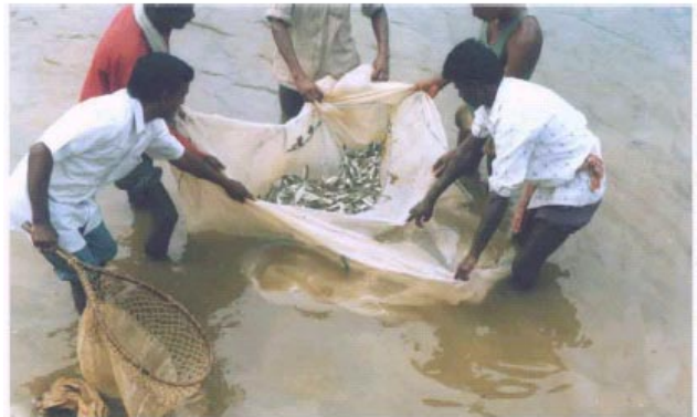
ଜ୍ଞାନକାରମାନଙ୍କର କ୍ଷମତା ଗଠନ

ଇ ଆଇ ଆର ଏଫ୍ ପି ଦଳର ସଭ୍ୟ ମାନଙ୍କ ଦ୍ୱାରା ଗଠନ କରାଯାଇଥିବା ଗ୍ରାମ ଗୁଡ଼ିକର ଉନ୍ନତି, ଦକ୍ଷତା ଏବଂ ସେମାନଙ୍କର କାର୍ଯ୍ୟ କ୍ଷମତାକୁ ପ୍ରତ୍ୟକ୍ଷ ଦର୍ଶନ କଲା । ଏହି ଯୋଜନା ସଭ୍ୟମାନଙ୍କୁ ଜ୍ଞାନକାରମାନଙ୍କୁ ଚିହ୍ନଟ କରିବାର ସୁଯୋଗ ଦେଲା ଯେଉଁମାନଙ୍କର ବିଭିନ୍ନ କାର୍ଯ୍ୟ, ଦକ୍ଷତା ବିଷୟରେ ମଧ୍ୟ ରୁଚି ଥିଲା । ସେହି ଜ୍ଞାନକାରମାନଙ୍କୁ ପ୍ରଶିକ୍ଷଣ ଏବଂ ତାଲିମ୍ ଦିଆଯାଇଥିଲା ଯାହା ଫଳରେ କି ସେମାନଙ୍କର ଦକ୍ଷତା ବୃଦ୍ଧି ପାଇଥିଲା । ଜ୍ଞାନକାରମାନେ ଏହି ସବୁ ବିଷୟରେ ତାଲିମ୍ପ୍ରାପ୍ତ ହୋଇଥିଲେ, ସେଗୁଡ଼ିକ ହେଲା ଦଳ ଗଠନ, ପରିଚାଳନା ସଂସ୍ଥ ଏବଂ ରଣ, ଦଳ ଗତ ଜମା ଅର୍ଥ ପରିଚାଳନା, ଫସଲ, ଜଳକୃଷି, ବୃକ୍ଷ, ଭୂମି ଏବଂ ଜଳ ସଂରକ୍ଷଣ, ଗୃହପାଳିତ ପଶୁ ଏବଂ ପରିବାର ଜମିବିହୀନ ଥିଲେ ସେମାନଙ୍କ ପାଇଁ ଅନ୍ୟାନ୍ୟ ଉତ୍ପାଦନକ୍ଷମ କାର୍ଯ୍ୟ (ତାହା ହେଉଛି ପତର ଥାଳି ତିଆରି, ବା ଖଲି, ଦଉଡ଼ି ତିଆରିକରିବା ଏବଂ କୁକୁଡ଼ା ଚାଷ)